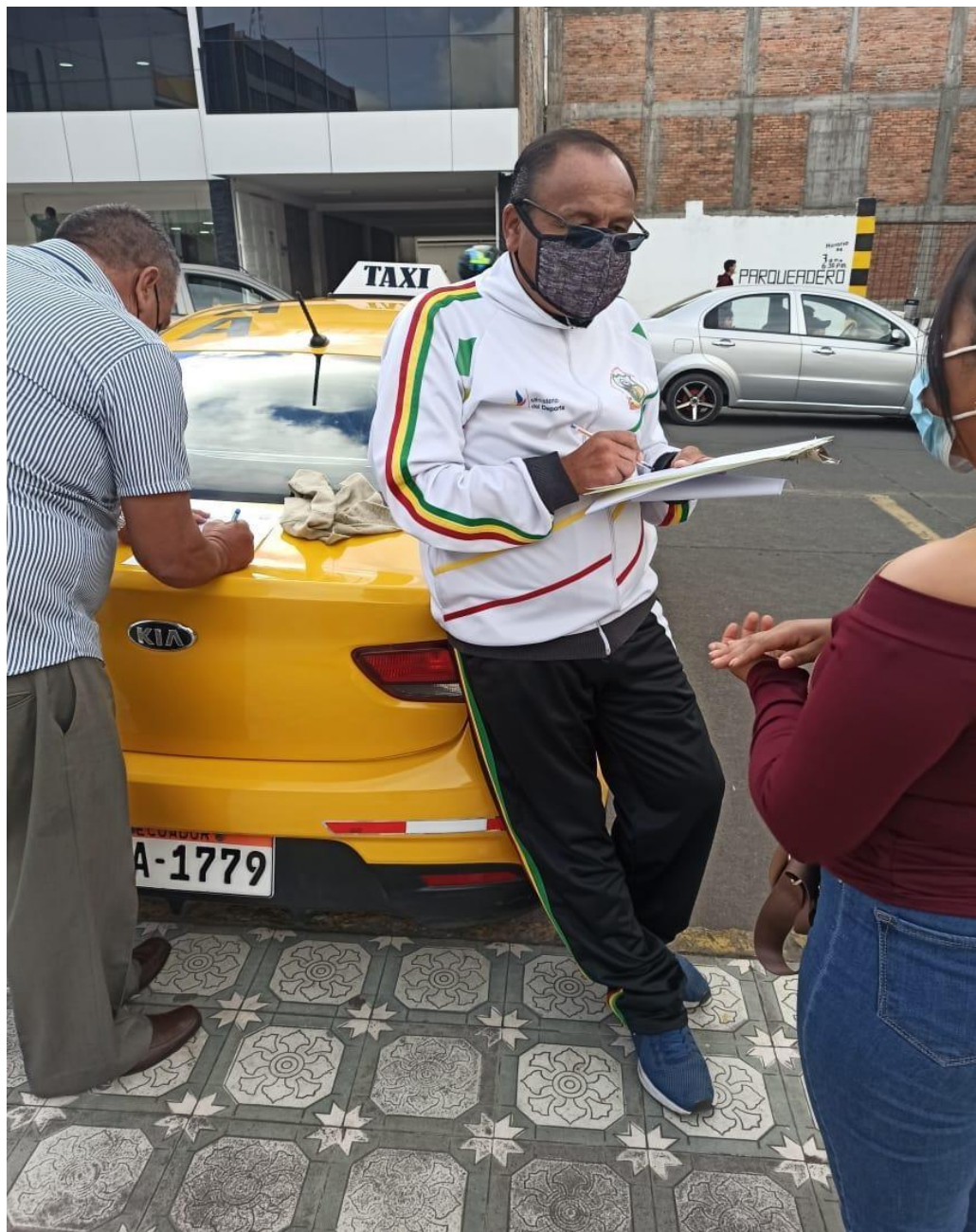
Figura 2. Diagnóstico a conductores taxis de la ciudad de Tulcán.