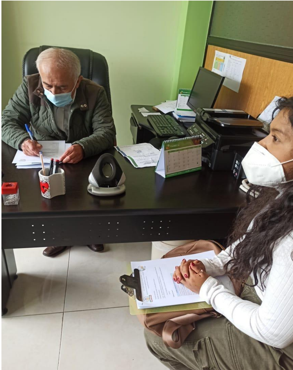
Figura 1. Investigación exploratoria.