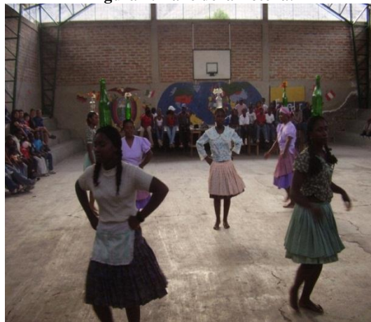
Figura 1: Baile de la Botella.