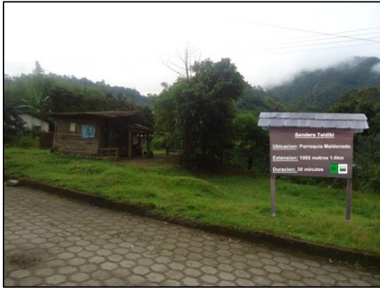
Tabla 2: Diseño de la señalética interpretativa Turística

Rotulo de entrada: El punto exacto donde se colocara la rotulación es la entrada de la parroquia Maldonado. Este letrero tendrá datos que sirven para dar a conocer la existencia de este atractivo el cual tendrá;