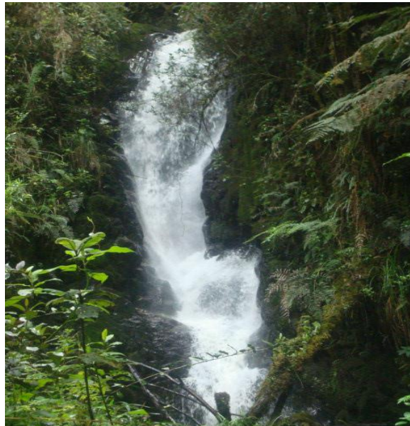
Las tres cascadas de San Francisco del Troje

Este lugar es idóneo para practicar actividades ecoturísticas, como el ascenso y descenso; actividad atractiva para turistas aquellos que gustan de la adrenalina brindando un ambiente favorable en paz y armonía con la naturaleza.