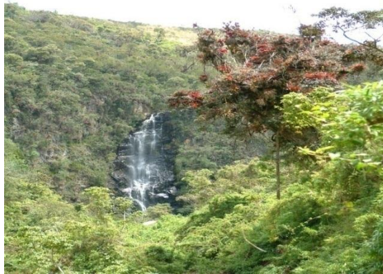
Cascada de Ymaran. Autora: Andrade Mayra.