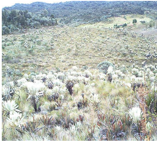
Potreros Autora: Andrade Mayra

Es este lugar se puede realizar diferentes actividades ecoturísticas como: cabalgatas, caminatas, camping.