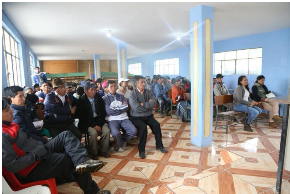
Figura 1. Asamblea de la comunidad para las realizar las entrevistas.