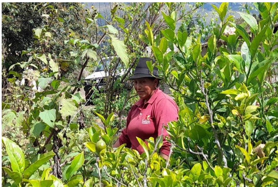
Figura 2. Cultivos de las fincas de la comunidad