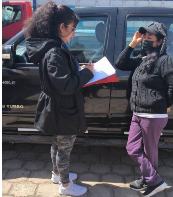
Figura 3. Entrevistada 1