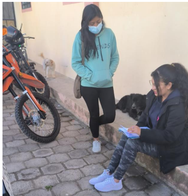
Figura 4. Entrevistada 2