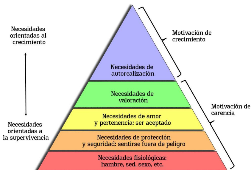
Figura 1 Pirámide de las necesidades de Maslow Nota. Pirámide sobre la motivación humana, 1943.

La teoría de la Pirámide de las Necesidades, propuesta por Abraham Maslow en su obra "Una teoría sobre la motivación humana" en 1943, presenta un rango psicológico de las necesidades humanas. Según esta hipótesis, los aspectos más fundamentales se ubican en la parte inferior de la pirámide, ya medida que las personas satisfacen estas necesidades básicas, desarrollan aspiraciones y deseos más elevados, los cuales se sitúan en la parte superior de la pirámide.