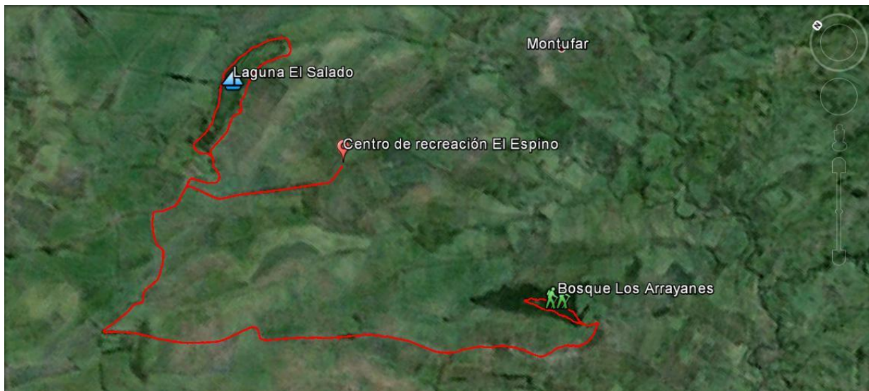
Ilustración 1: Ruta del paquete turístico