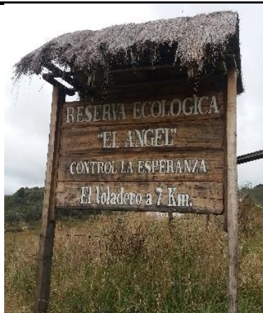
Tabla 5. Figuras de la Señalética de la Reserva Ecológica el Ángel

Dentro de las áreas naturales, cuenta con 3 pictogramas de atractivos naturales de madera, 2 pictogramas de actividades turísticas y 4 pictogramas de servicios de apoyo. También cuenta con 2 señales turísticas de aproximación de madera, 2 paneles de direccionamiento hacia atractivos de madera, 2 paneles informativos de atractivos de madera, 4 paneles informativos de direccionamiento hacia atractivos, servicios y actividades de madera, por ultimo dentro de letreros informativos existen 7 de información botánica. Ejemplos de la señalética del atractivo, se muestran en la Tabla 5.