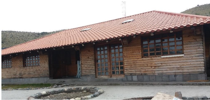
Figura 3. Guardianía El Voladero

Y en cuanto a la señalética, dentro de las áreas urbanas, el atractivo cuenta con 5 pictogramas de atractivos naturales, 2 de madera y 3 de aluminio, 2 pictogramas de actividades turísticas de aluminio y tres pictogramas de servicio de apoyo.