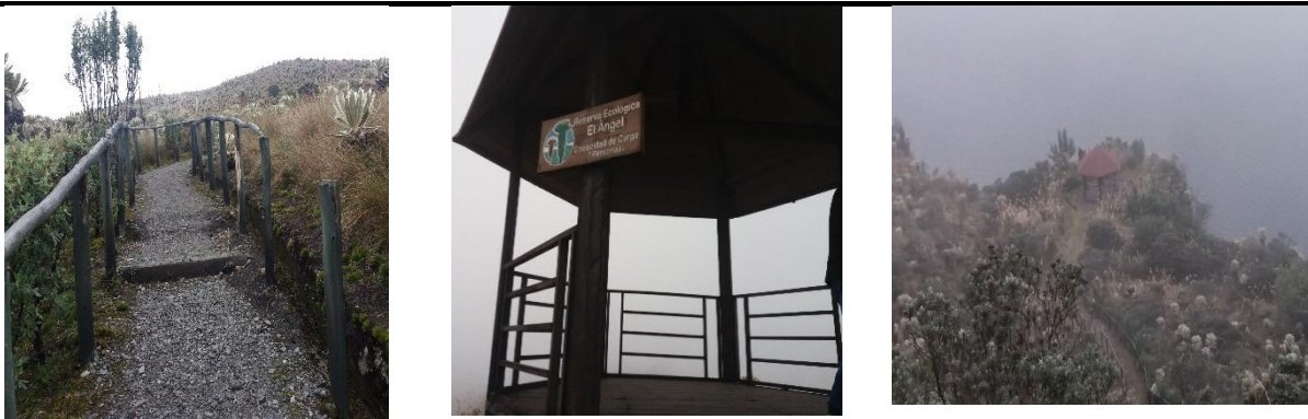
Tabla 6. Figuras del sendero y de los miradores de la Laguna El Voladero

Y por último, para un fácil acceso a la Laguna el Voladero, ésta cuenta con un sendero auto guiado, denominado sendero natural auto guiado El Voladero, con una longitud de 2500m, un tiempo de recorrido de 1h.30', este sendero cuenta con paradas interpretativas, áreas de descanso y dos miradores, uno de ellos tiene el nombre de Corazones sanos con una altitud de 38000msnm y capacidad para 7 personas. Un punto negativo de este sendero, es que los pasamanos se encuentran en mal estado, perjudicando la seguridad de los turistas que visitan este atractivo. En la Tabla 6 se encuentran imágenes del sendero y miradores del atractivo.