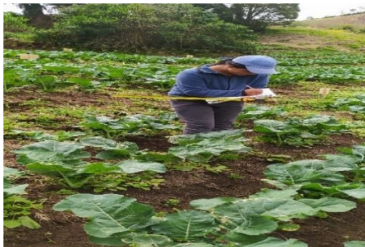
Figura 13. Toma de datos