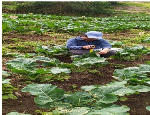
Figura 12. Toma de datos