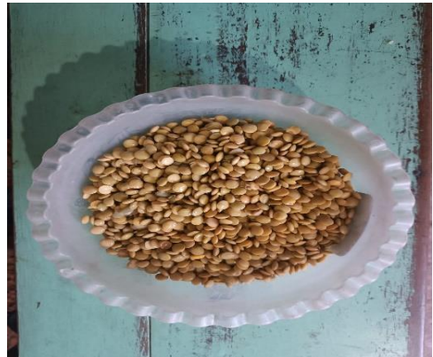
Figura 6. Lenteja