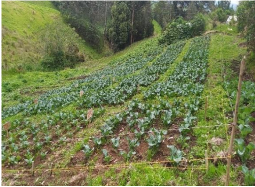
Figura 9. Cultivo brócoli