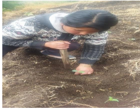
Figura 4. Siembra