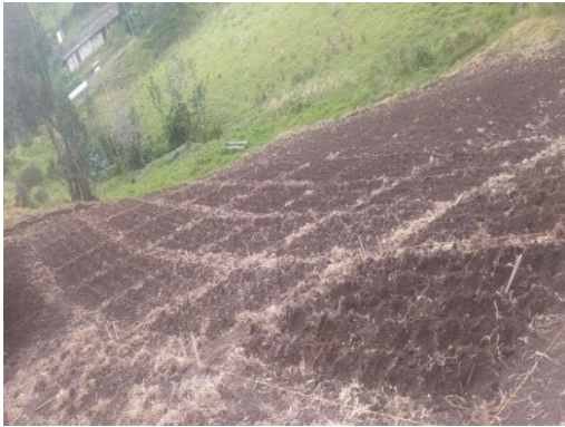
Figura 3. Preparación suelo