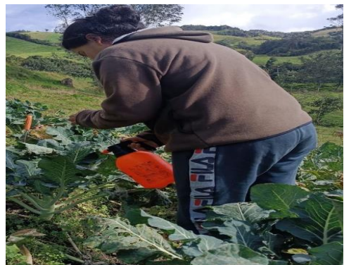
Figura 8. Aplicación extractos