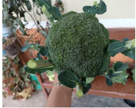
Figura 18. Cosecha