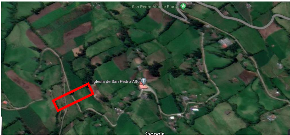
Figura 1. Google maps,2022

La presente investigación se realizó, en la provincia-Carchi, Cantón-Montufar, Parroquia Piartal, Comunidad-San Pedro Alto está se encuentra situada al noroeste de la ciudad de San Gabriel, tiene una altitud de 2980 m.s.n.m, con las siguientes coordenadas geográficas 0^{\circ}37'N 77^{\circ}50' , una temperatura promedio de 12.5^{\circ}C y la humedad es de 90-92% (MONTUFAR, 2023) Figura 1.