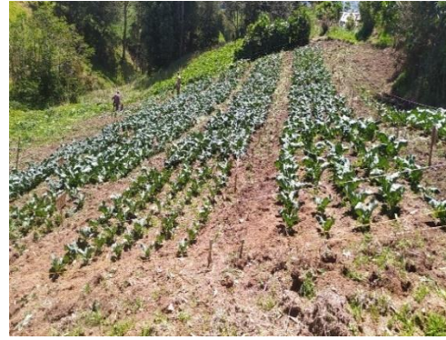
Figura 10. Cultivo brócoli