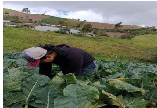
Figura 14. Toma de datos cosecha