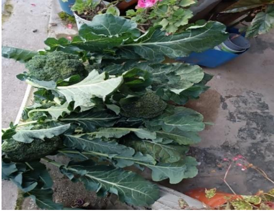
Figura 17. Cosecha