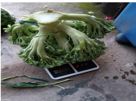
Figura 15. Toma del peso