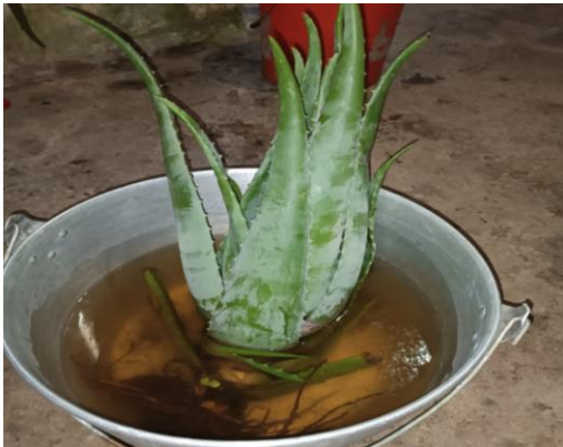
Figura 5. Sábila