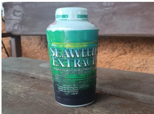
Figura 7. Extracto de algas