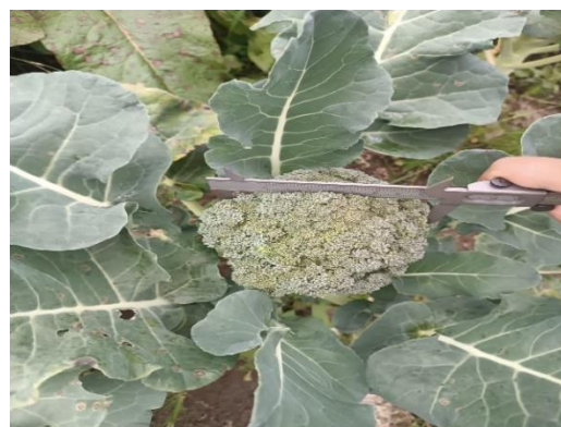
Figura 16. Diámetro