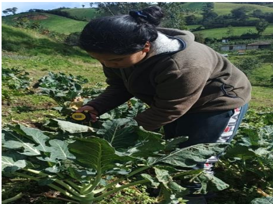
Figura 11. Toma de datos