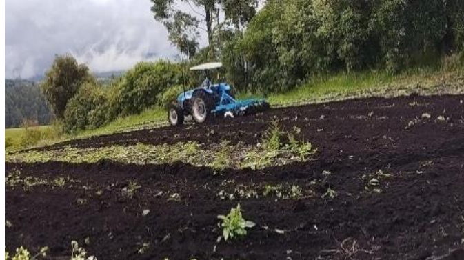
Figura 4. Preparación del terreno para realizar el diseño experimental del cultivo de arveja variedad Quantum