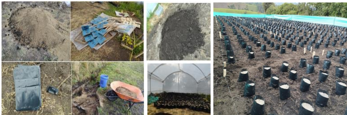
Figura 6. Implementación del diseño experimental y llenado de fundas