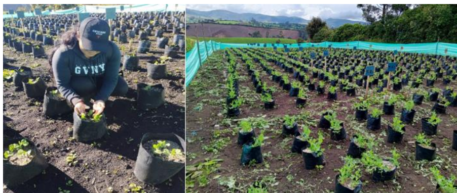
Figura 8. Realización del deshierbe en el cultivo de arveja variedad Quantum en caminos y fundas