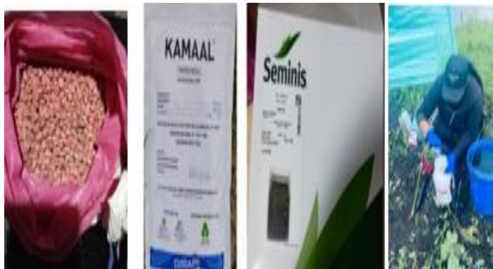
Figura 7. Desinfección de semilla y siembra del cultivo de arveja variedad Quantum