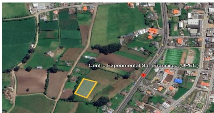
Figura 1. Ubicación del terreno en cantón Huaca-Finca Experimental San Francisco UPEC

La presente investigación se llevó a cabo en el Centro Experimental San Francisco de la Universidad Politécnica Estatal del Carchi; el área del terreno utilizado fue de 1386 m 2 con unas dimensiones de 33m de ancho por 42m de largo, el experimento se instaló a una altitud de 2923 m.s.n.m en el cantón Huaca provincia del Carchi, la temperatura promedio es de 12.7°C y su humedad relativa de 78 %.