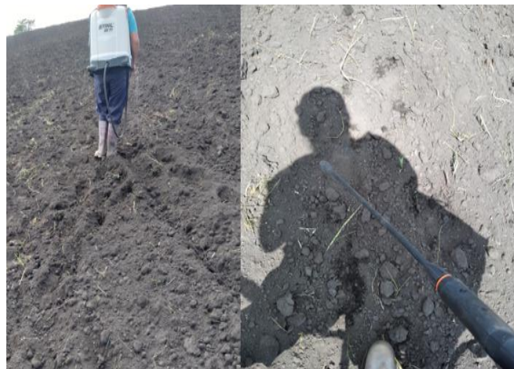
Figura 5. Desinfección del suelo previo a la siembra del cultivo de arveja