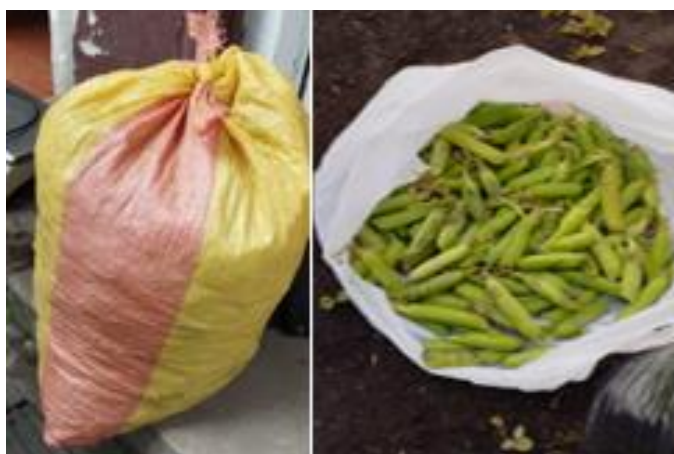
Figura 9. Rendimiento de la primera los 97 días en la cosecha del cultivo de arveja variedad Quantum