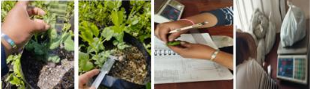
Figura 10. Variables de la Investigación