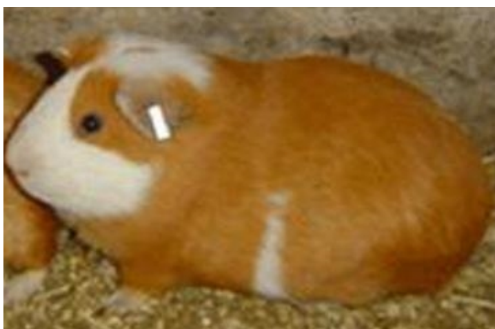
Figura 2: Cuy Tipo 1.

Tipo 1: Es de pelo corto, lacio y pegado al cuerpo, está entre los más difundidos y caracteriza al cuy peruano productor de carne. Puede o no tener remolino en la frente. Se encuentran de colores simples claros, oscuros o combinados. Es el que tiene el mejor comportamiento como productor de carne.