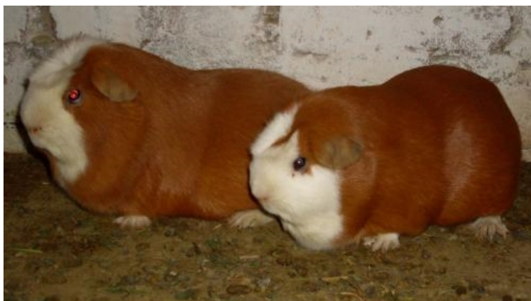
Figura 1: Cuy Tipo A.