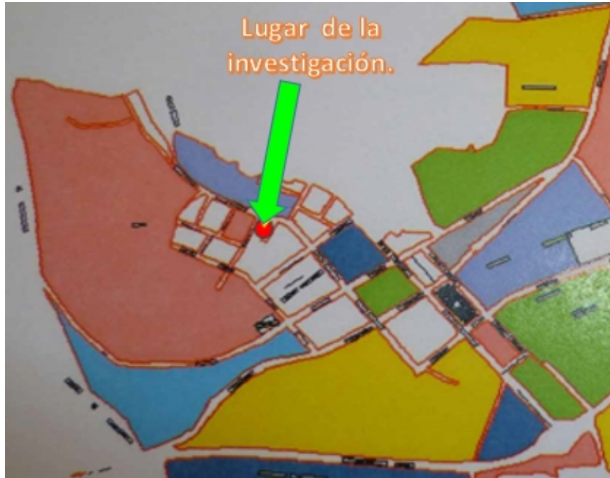
Figura 4: Mapa geográfico de la parroquia Cristóbal Colón.