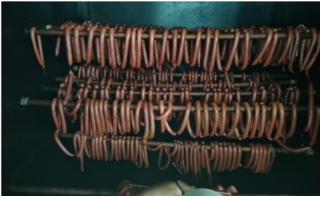
Figura 7. Proceso de ahumado.