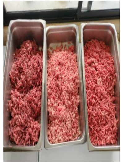
Figura 4. Carne de cordero, cerdo y res molida.