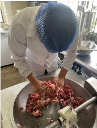
Figura 5. Mezclado de condimentos y especias.