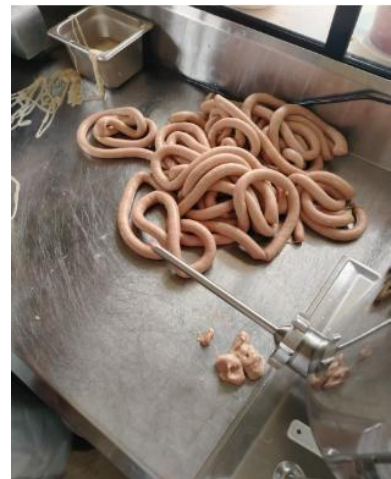
Figura 6. Embutido en tripa.