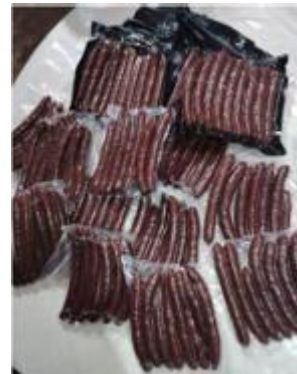
Figura 10. Empacado al vacío.