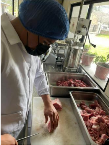
Figura 3. Cortado de la carne.