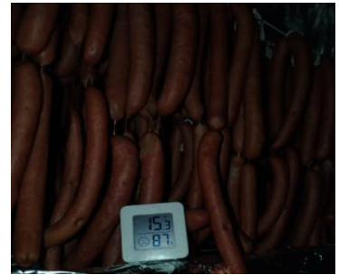
Figura 8. Control de temperatura y humedad relativa.