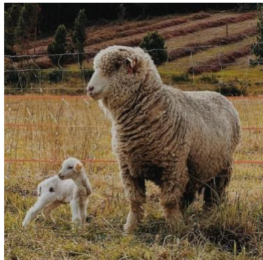
Figura 1. Cordero de la raza Poll Dorset ( Ovis aries )

Los corderos sudamericanos presentan una rica diversidad genética, con varias razas adaptadas a las condiciones locales. Entre los más notables se encuentran el Cordero Patagónico, conocido por su carne de alta calidad y adaptación a climas fríos; el Cordero Merino como también el Poll Dorset, famoso por su lana y carne apreciada en diversas cocinas; y el Cordero Blackbelly, que se adapta bien a climas cálidos y es valorada por su resistencia y calidad de carne. En la figura 1 se presenta el cordero de la raza Poll Dorset ( Ovis aries ).