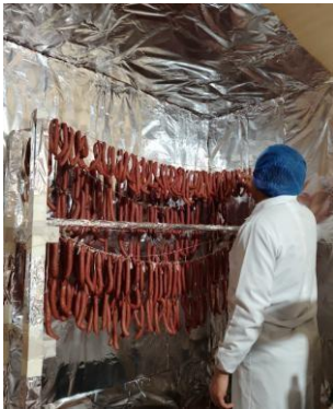
Figura 9. Acondicionamiento del lugar de maduración.