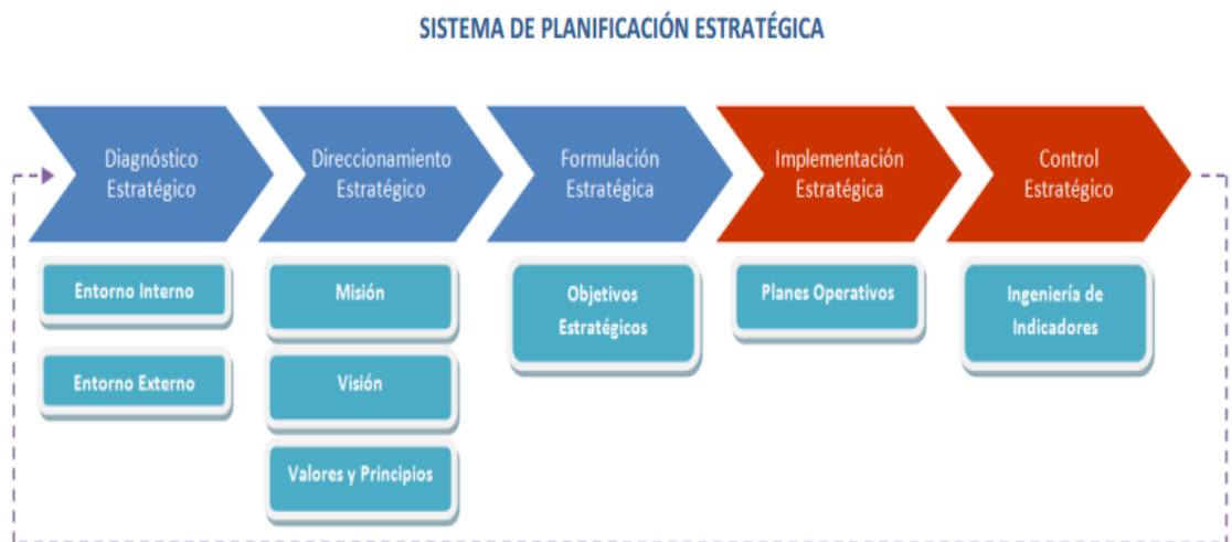
Figura: 2: Sistema de planificación estratégica.

Para alcanzar la valorización de los recursos turísticos se lleva a cabo el diseño de un plan estratégico, el mismo que sigue el esquema que se describe a continuación.