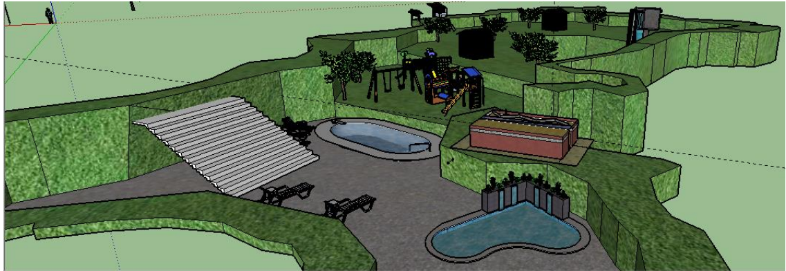
Figura 3: Estructura planteada para las piscinas y cascada de Palúz.

los turistas. En la figura se describe el acondicionamiento del área para ser presentada ante el mercado turístico.