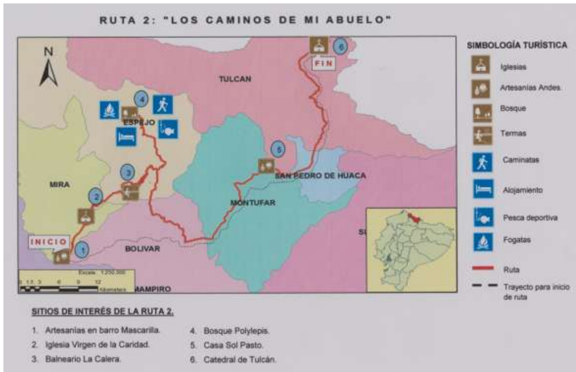
Figura 4.3: Ruta turística 2.