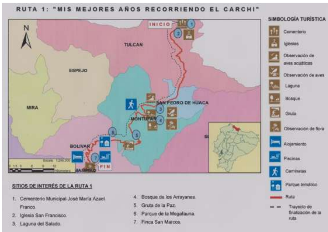
Figura 4.2: Ruta turística 1.